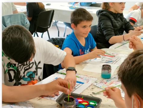
Réalisation de vitraux à Noiriac Mai 2022