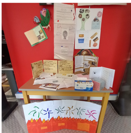
Un aperçu des restitutions de la mission "Je présente mon identité multiple".