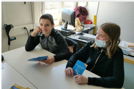
Jeu éducatif de cartes conçu pour faire découvrir la richesse de domaines du PCI. Avril 2022.