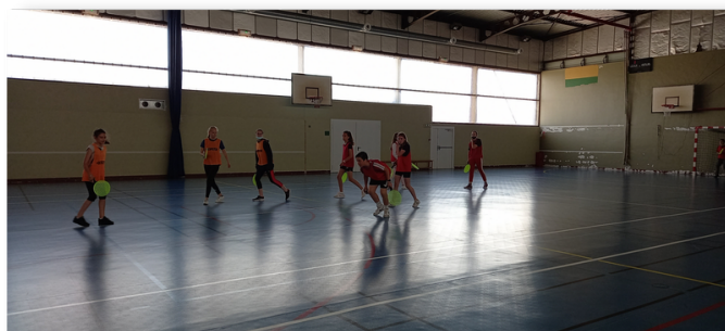
"Le Hurling" adaptation du jeu traditionnel irlandais. Mai 2022